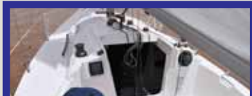
Cockpit bem distribuído