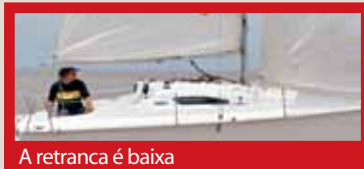
A retranca é baixa