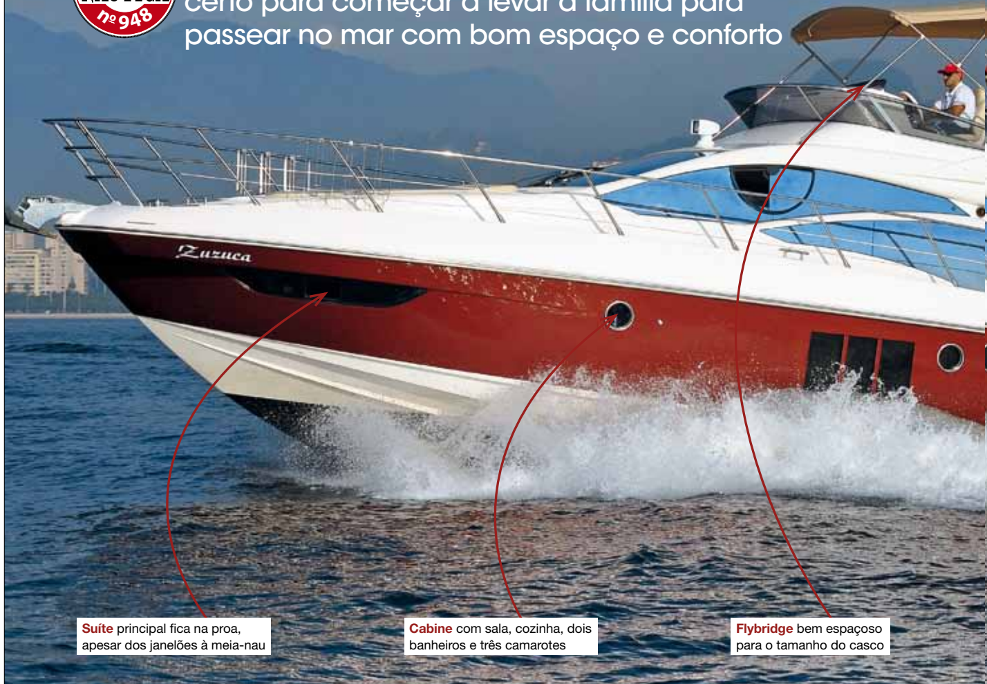
Suíte principal fica na proa, apesar dos janelões à meia-nau

Esta lancha italiana, que já está sendo fabricada também no Brasil, tem o tamanho certo para começar a levar a família para passear no mar com bom espaço e conforto