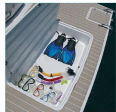
A nova plataforma de popa recebeu um paiol grande para armazenar os brinquedos a bordo