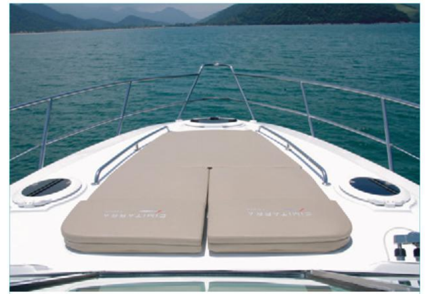
A proa tem um solário grande e o acesso agora é feito por um passadiço lateral e não mais pelo centro do barco