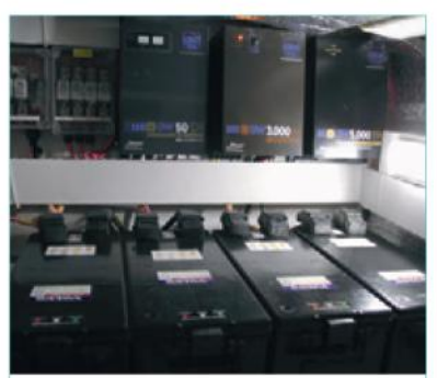
A instalação dos equipamentos segue o padrão de qualidade do estaleiro, que exportará para o mercado americano