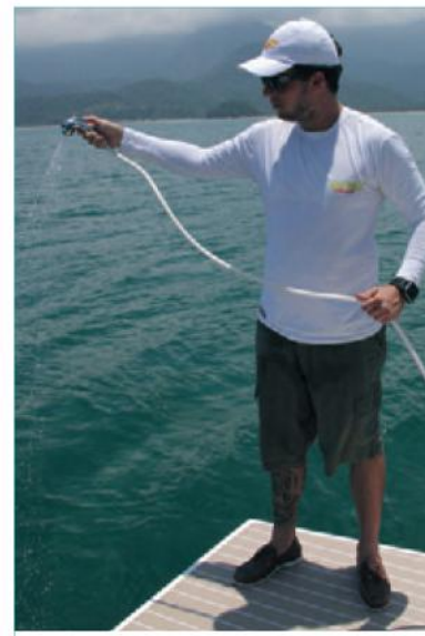
O chuveiro de popa tem ótimo tamanho de mangueira