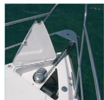
O paiol da âncora é grande e tem bastante espaço interno