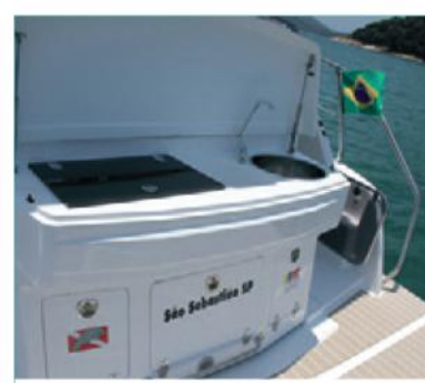
O módulo gourmet pode ser substituído por um solário de popa. Mas 100% dos barcos vieram com essa área