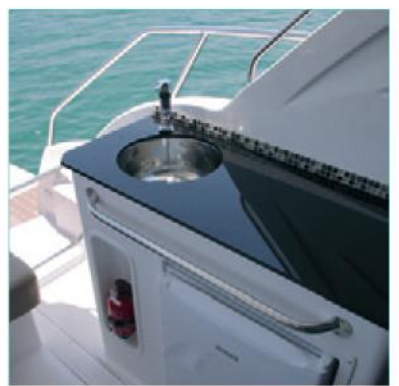
O módulo vem de série, tem pia, espaço para um cockpit e geladeira (opcionais)