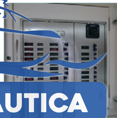
O painel elétrico e toda a parte elétrica da 360 HT são feitos pela CS Náutica, empresa referência no mercado

navegando em velocidade máxima o barco continuou apresentando bons resultados e gastando uma quantidade esperada de diesel para o conjunto.