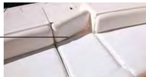
POPA Para embarcar, o assento do sofá pode ser removido e o encosto vira portinhola