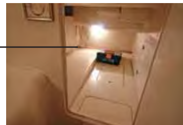
PAIOL O banheiro dá acesso a um grande paiol, que tem, também, espaço sob o piso