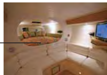
CABINE Vem equipada de fábrica, com cama de casal de bom tamanho e divisória