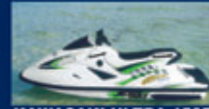
KAWASAKI ULTRA 150R