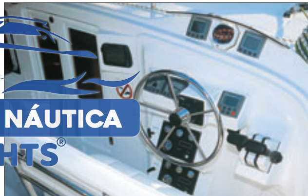
Painel Eletrônicos e relógios da dupla motorização: o posto de comando proporciona visibilidade total ao timoneiro

Vamos agora à velejada. Mesmo presa entre dois barcos, a saída do Dolphin 430 foi simples, graças à dupla motorização que possibilita girar o barco em seu eixo rapidamente. É mais uma vantagem dos catamarãs. A visão das duas proas, estando no posto de comando é perfeita e os manetes estão bem próximos da roda de leme. Assim é só sair em direção ao vento e subir a vela grande (de enrolar) que tem, por sinal, um tamanho assustador. Desenrolamos a genoa, abaixamos