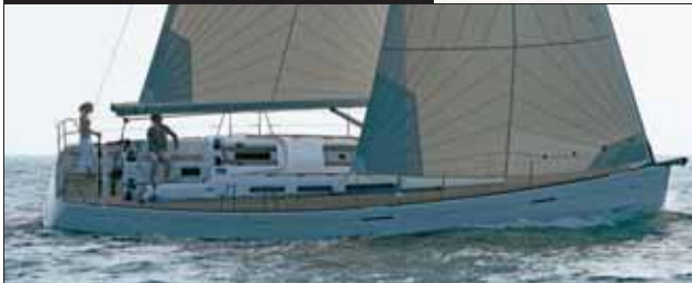
Dufour 45 E Performance Construído pelo estaleiro Dufour, tem três bons camarotes (e um quarto opcional), sendo uma suíte, e dois banheiros. O seu ponto forte é, como o nome já diz, a performance.

Disputa mercado com outras duas marcas francesas consagradas no Brasil