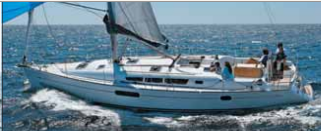
Jeanneau 44i Performance Versão para regata do Sun Odyssey 44i, tem casarío com baixo perfil e uma série de acessórios para aumentar sua performance, como hélices de baixo arrasto.