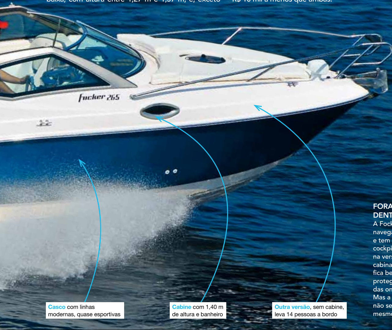
Casco com linhas modernas, quase esportivas

A Focker 265 agrada pelo bom desempenho, pelas linhas modernas e esportivas e pelo cockpit, que nesse tipo de barco é sempre melhor do que a cabine, embora a dela tenha acabamento acima da média. A lancha testada, com um motor a gasolina de 300 hp e completa, com muitos equipamentos opcionais, custa R$ 233 mil. Mas, com motor de 220 hp e apenas itens de série, ela custa a partir de R$ 175 mil. E também há uma versão Open, de proa aberta, sem cabine, mas com banheiro e capacidade para até 14 pessoas, recém-lançada no Rio Boat Show, por R$ 10 mil a menos que ambas.