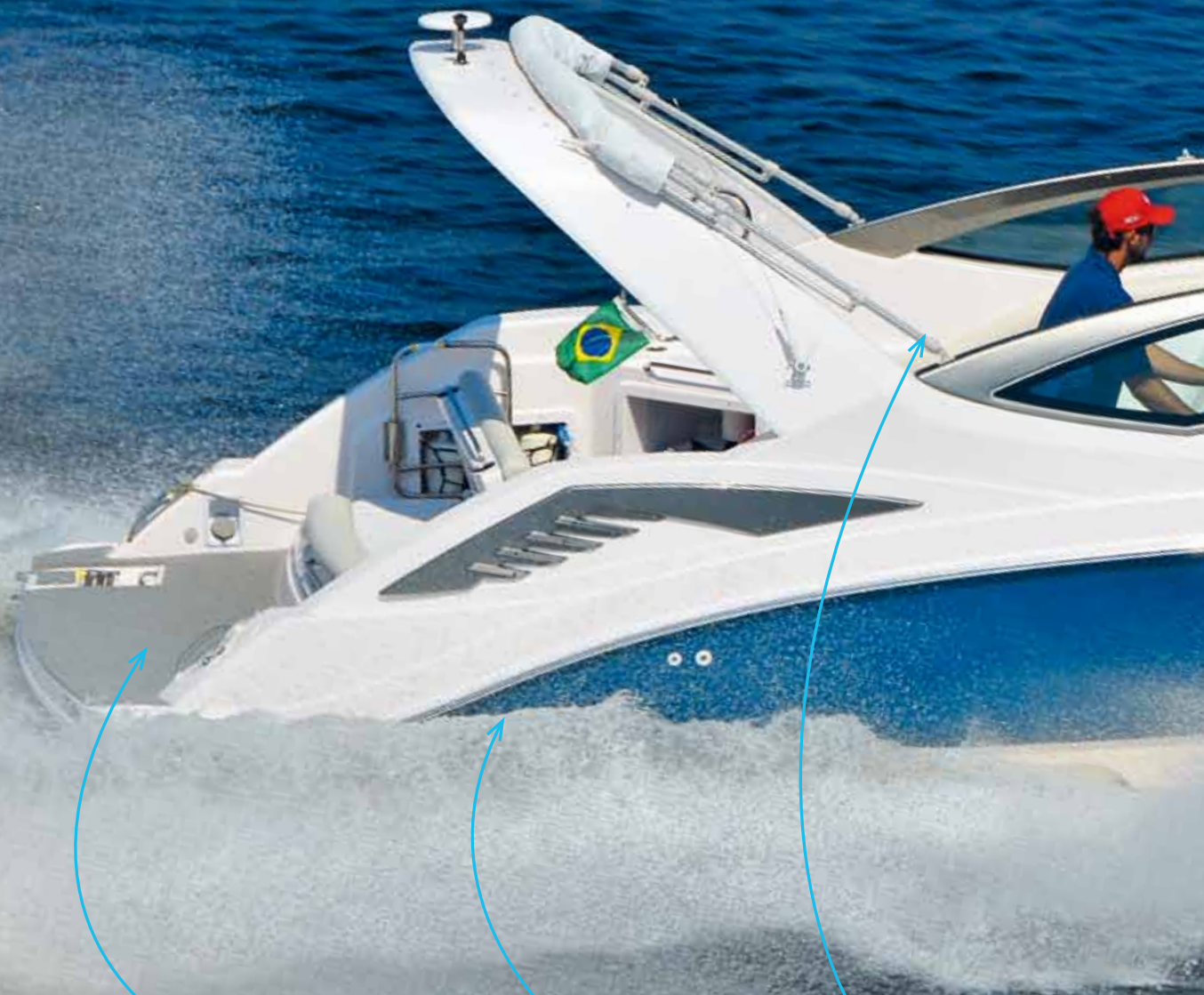
Plataforma de popa de bom tamanho

A nova lancha da Fibrafort agrada bastante no estilo e no desempenho, mas nem tanto assim na cabine