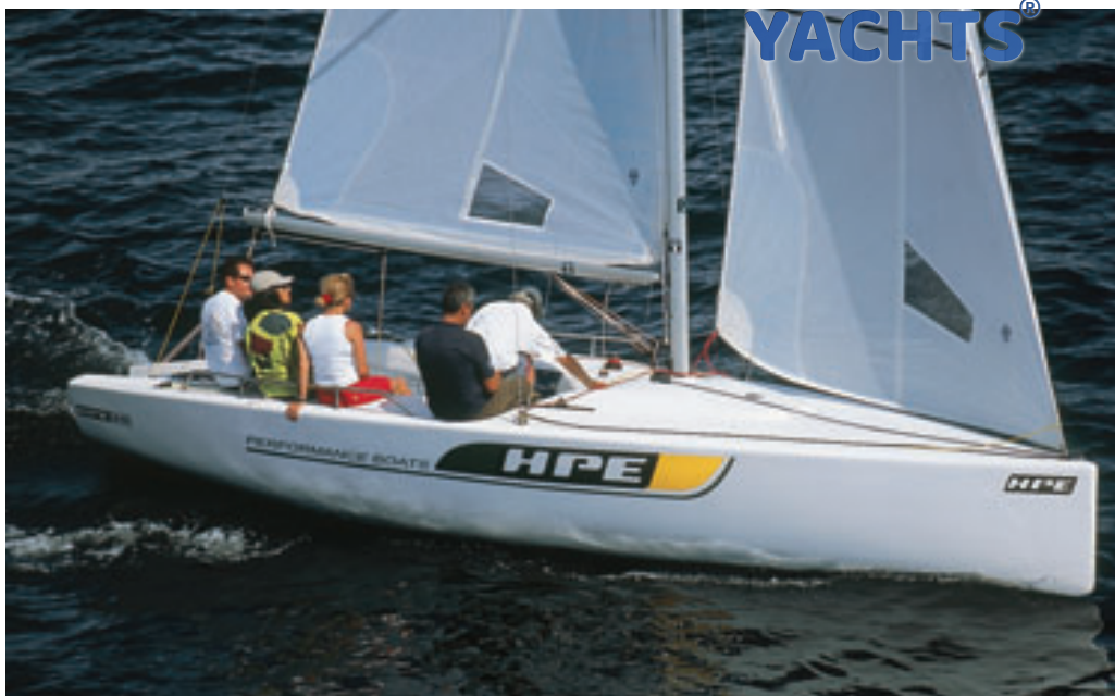
Padronizado, ele é fácil de velejar mesmo para tripulantes sem muita experiência