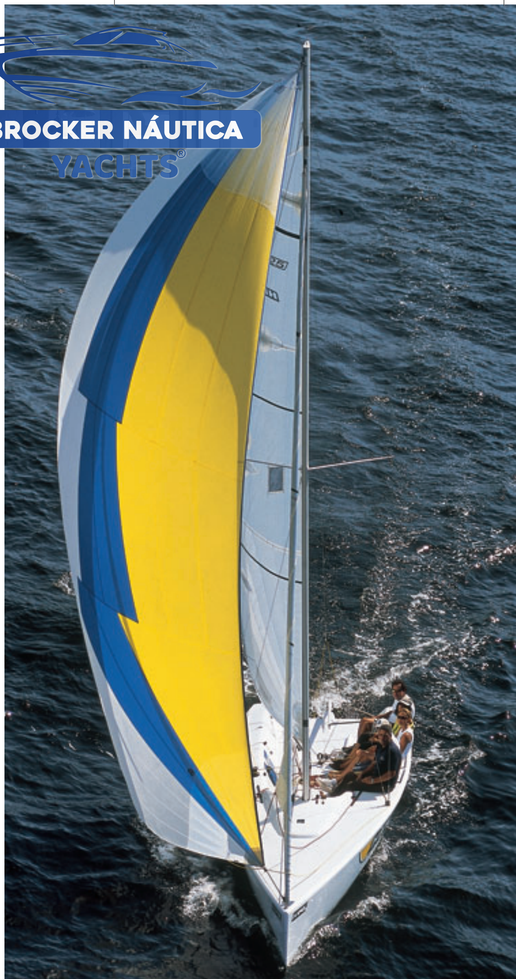
Com balão assimétrico e mestra, a área vélica do HPE 25 passa dos 85 m 2

Outras informações com Regatta: Rua Alvarenga, 2.121, CEP 05509-005, São Paulo (SP), tel. (11) 3030.3400 e site www.regatta.com.br