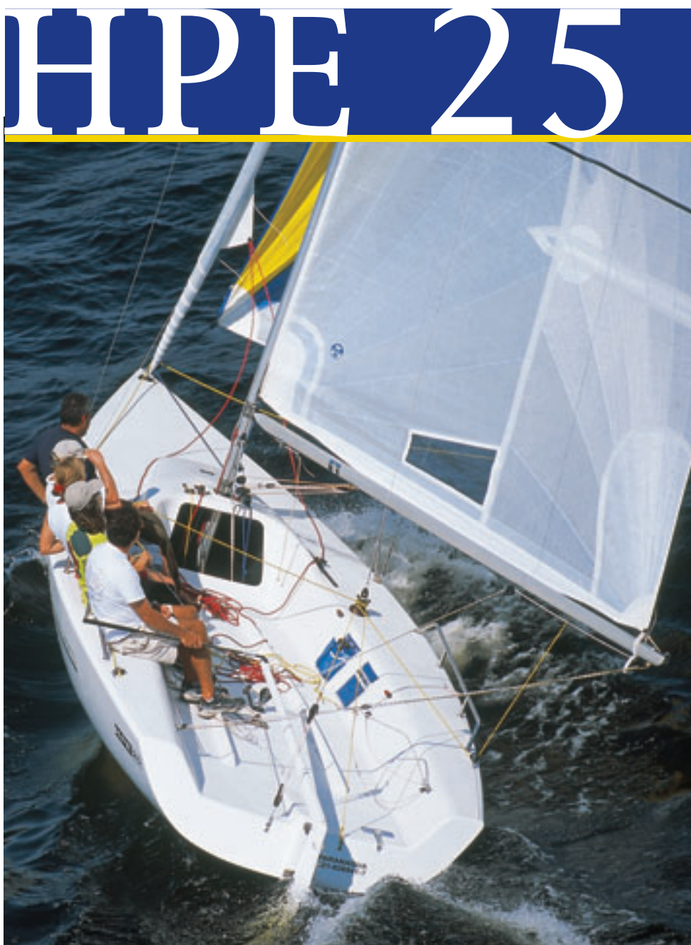
Guarda-mancebo impede que tripulantes façam contrapeso com o corpo fora da borda

Para realizar o projeto, Souza Ramos solicitou ao renomado projetista naval Javier Soto Acebal que desenhasse um veleiro de quilha e com balão assimétrico. A partir daí foi construído um protótipo, experimentado exaustivamente para consertar possíveis imperfeições e encontrar os melhores ajustes, como os pontos ideais da ferragem e mastreação. Detalhe: o HPE 25 está sendo construído na HPE, fábrica em que a Mitsubishi Motors do Brasil trabalha com uma linha de carrocerias esportivas — também de fibra de vidro — para automóveis que competem em ralis e também para veículos de rua da série HPE ou High Performance Equipment . Mais: o novo veleiro é laminado com infusão de resina a vácuo, tecnologia industrial que assegura uniformidade e rapidez na fabricação. Pelo processo, a fôrma do barco recebe os tecidos de fibra de vidro e os reforços durante a construção. A seguir, a fôrma é lacrada e cria-se vácuo para injetar a resina. Resultado: o per-