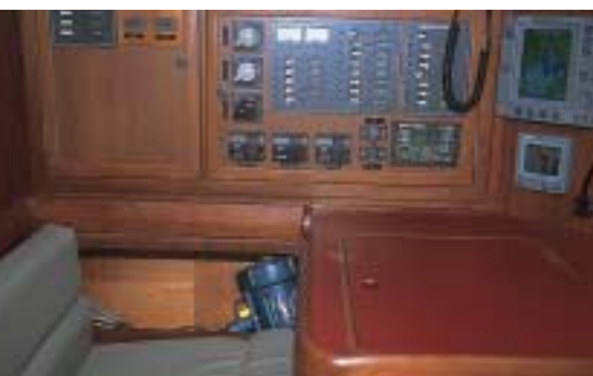
Mesa de navegação: espaço privilegiado, com tudo à mão

Quanto à parte elétrica, há seis baterias de 110 Ah cada e uma de 150 Ah só para o motor. Para recarregá-las, o barco tem o alternador do motor, quatro placas solares e dois geradores eólicos de 20 A cada. Um transformador aceita entrada de 80 V a 250 V, estabilizando a tensão em 127 V. Com energia de terra, um carregador (que também é um inversor de 12 VCC para 127 VCA) dá conta das baterias. O Bravo II está preparado para receber um gerador, e a saída para os gases já está no costado. A instalação elétrica é bem-feita, com fios estanhados, terminais soldados, cabos numerados e presilhas de