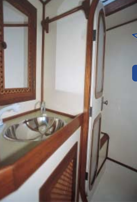
Dois tanques de 550 litros cada abastecem banheiros e cozinha