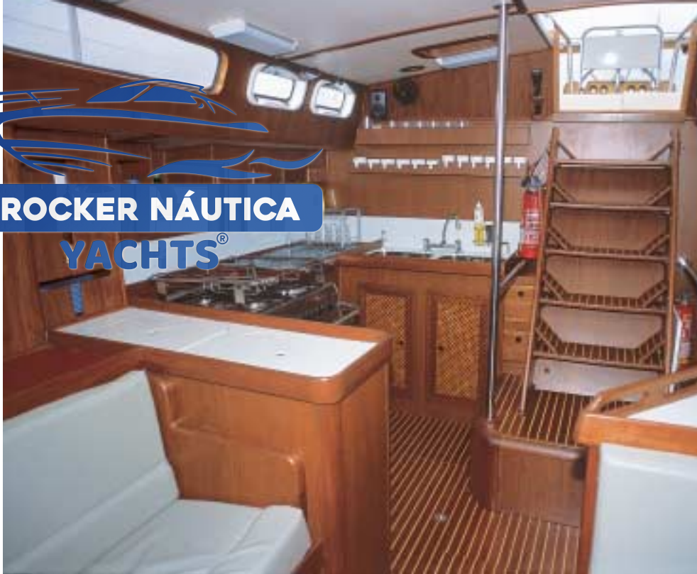
A cozinha, em "U", dispõe de fogão de quatro bocas montado sobre eixo cardã e duas pias com água doce quente e fria e água salgada para lavagens triviais