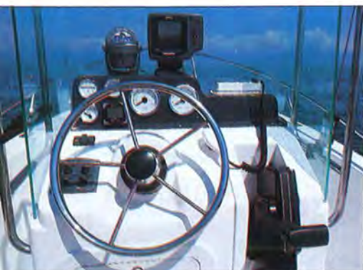
Painel Tem lugar para relógios do motor e eletrônicos básicos

mas os coletes salva-vidas deveriam ter paiol próprio, talvez sob o banco do piloto. Na verdade, o estaleiro está estudando a possibilidade de mudar a localização do tanque de combustível (instalado sob o assento do piloto) para baixo do console.