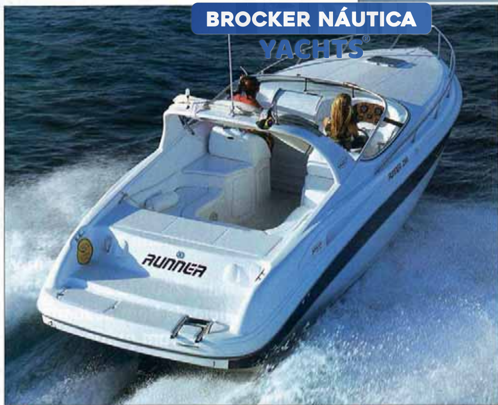
Popa Plataforma de ré espaçosa e escada de popa integrada facilitam o acesso à água

Existem paióis para guardar cabos de reserva (como as espigas de amarração) e material de limpeza, embora faltem armários próprios para as defensas e também para a âncora de reserva. Claro que esse material pode ser acondicionado no compartimento do motor, mas não é a mesma coisa. Em relação ao compartimento do motor, gostamos do espaço para manutenção existente ao redor do Mercruiser diesel D4.2L D-Tronic, de 225 hp no hélice. Ficou faltando somente uma iluminação mais adequada e a fixação correta das baterias.