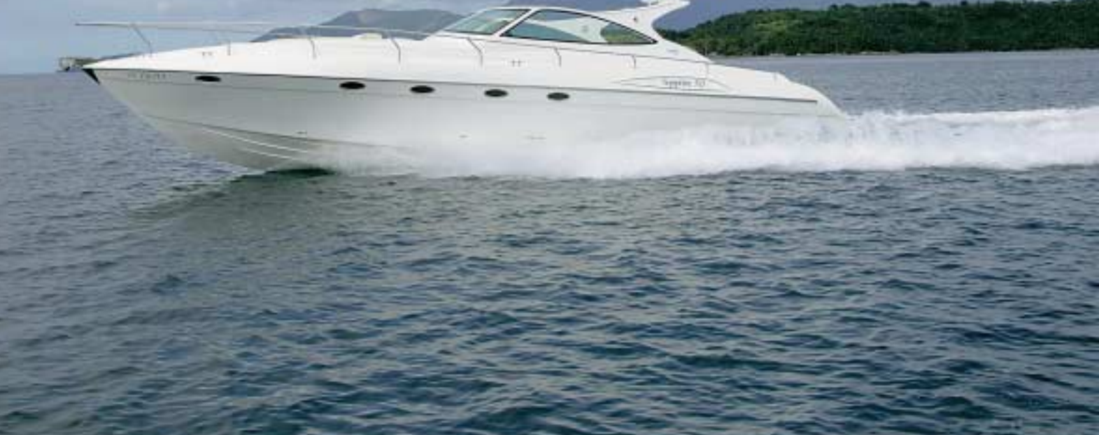
Impulsionada por dois motores Volvo TAM75P EDC de 480 hp cada, a Sapphire 50 atinge o planeio com facilidade

leiro, e neste aspecto a Sapphire 50 conta com outro ponto positivo: a plataforma de popa tem 1,16 m de largura, dimensão bem apropriada para o manuseio do bote ou do jet ou mesmo para entrar e sair da água.