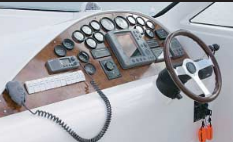
O painel é grande o suficiente para acomodar eletrônicos e os relógios. Na garagem de 3 m por 0,97 m, há espaço para o bote

tanto ao salão como ao camarote de hóspedes. Já o camarote do proprietário tem banheiro privativo (menor do que o banheiro de hóspedes). O camarote para um marinheiro é acessado diretamente pelo cockpit e fica isolado da cabine. A quantidade de armários na cozinha não é grande, mas os camarotes têm armários com cabideiros e a geladeira tem tra-