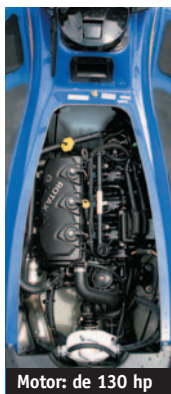
Motor: de 130 hp

Além do painel com todos os comandos à mostra o tempo todo, este jet é muito estável, o que é bom para quem quer apenas passear com tranquilidade e segurança