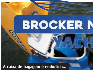
A caixa de bagagem é embutida...