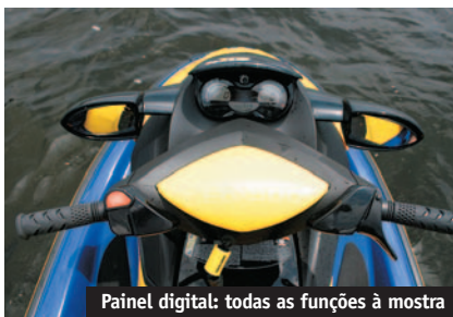
Painel digital: todas as funções à mostra