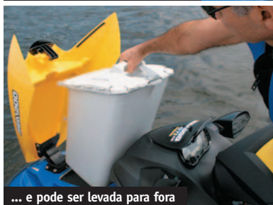
... e pode ser levada para fora

O GTI 4-TEC SE é o jet com o maior motor da sua categoria