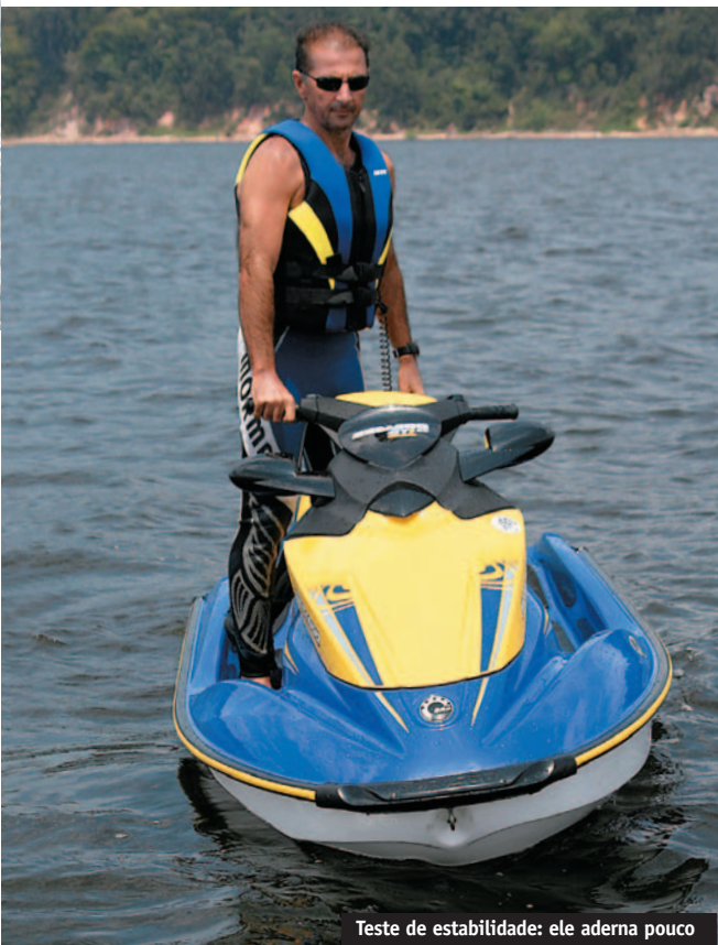
Teste de estabilidade: ele aderna pouco

O GTI 4-TEC SE é o jet com o maior motor da sua categoria