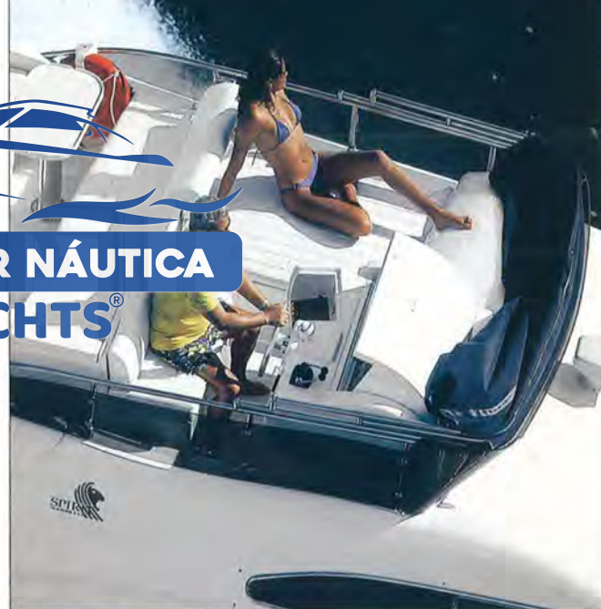
Flybrige Ponto nobre: lugar para relaxar e curtir

te a profundidade da onda que acompanha o barco, conhecida também como resistência de onda. Para vencê-la é necessário mais potência e mais consumo, tornando o barco ainda mais pesado. E a Spirit Ferretti seguiu a risca o conceito de iate: abriu mão de alguns poucos nós na performance para fornecer o maior conforto possível aos passageiros. ⚓