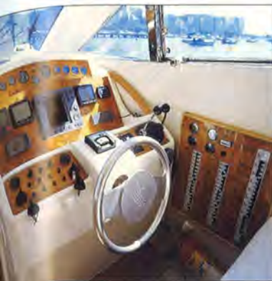
Painel Visibilidade e espaço para eletrônicos e relógios

mos conferir as medidas com o radar veio a paga pelo excelente conforto: a maior velocidade registrada ficou na casa dos 27 nós (50 km/h), algo confortável e satisfatório para pequenos cruzeiros, permitindo — em regime de cruzeiro a cerca de 22 nós (41 km/h) — uma travessia entre Rio de Janeiro e Angra dos Reis em pouco mais de três horas.