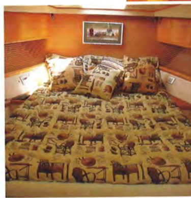
Camarote Localizada na proa, a master suíte tem 2 m de pé-direito, armários com cabideiros e boxe fechado