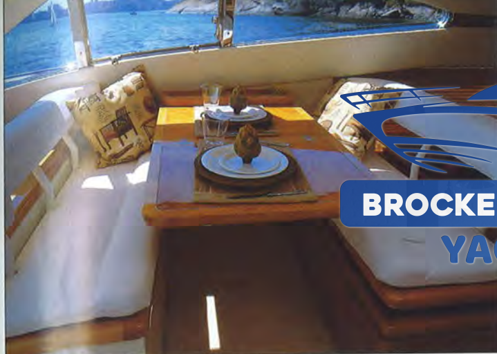
Dinete Tem visão privilegiada a vante e para os bordos

(uma suíte com cama de casal e duas cabines com camas de solteiro que dividem o banheiro de bombordo). O pé-direito nos camarotes é alto (mínimo de 1,99 m) e o material utilizado é de qualidade, com design aprimorado. Tudo na medida, enfim, para proporcionar o repouso necessário para quem passa o dia usufruindo as delícias do mar.