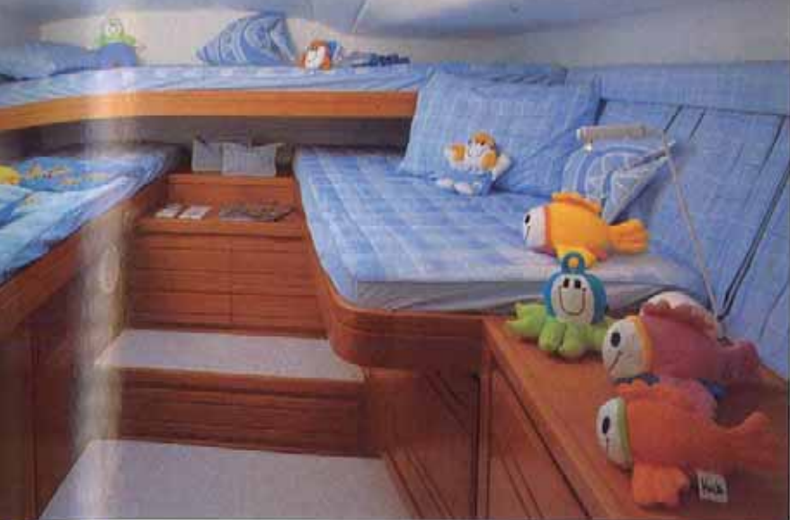
Camarote A boreste, ele pode ser utilizado para o pernoite de três passageiros

proprietário — tem espaço para os relógios da dupla motorização, bússola, quadro de interruptores, equipamentos de navegação (com radar e GPS/chartplotter separados) e rádios de curto e longo alcance (VHF e HF/SSB respectivamente). O único senão é a visibilidade adiante, prejudicada em parte por umas das pernas da estrutura tubular da torre de pesca.