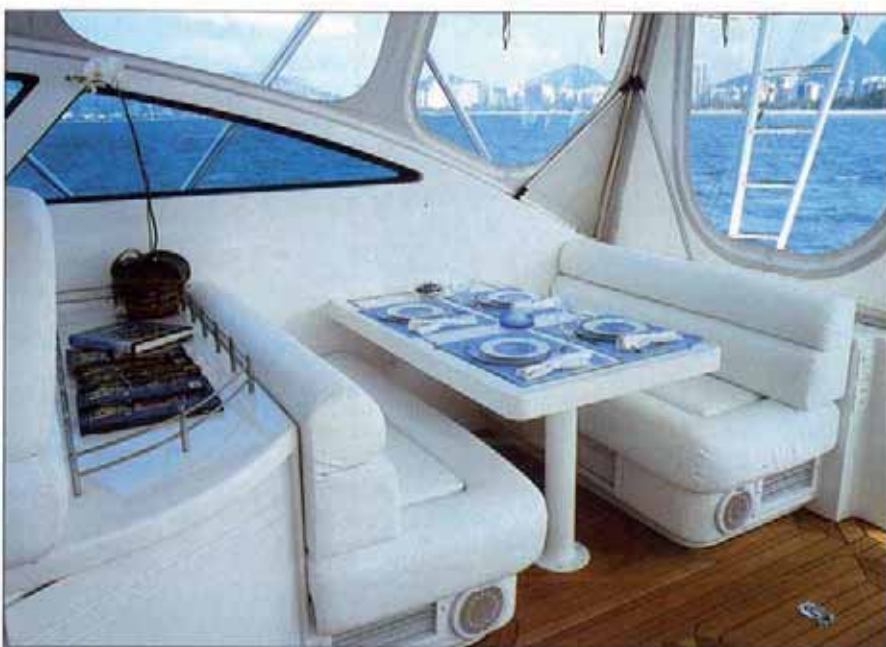
Salão Espacioso e equipado com dinete para quatro pessoas, ele tem convés revestido com teca e potente sistema de climatização (40 mil BTUs)

cos pequenos equipados com motor de popa. Uma embarcação a diesel com esse tipo de propulsão já pode ser considerada rápida quando gasta 10 segundos para chegar aos 20 nós. A vantagem disso, além de tornar o pilotar mais agradável, é a segurança para desviar de outro barco ou para escapar de uma