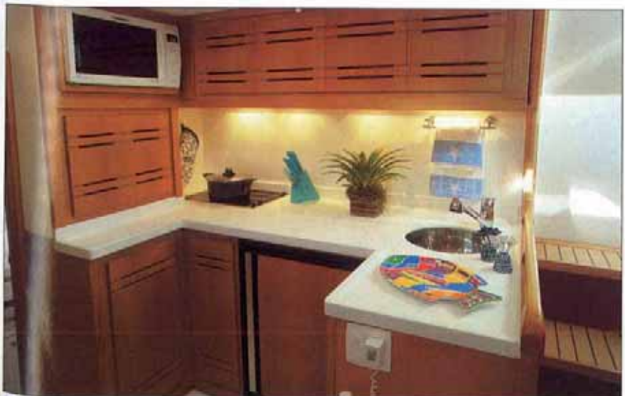
Cozinha Muito bem-equipada e decorada com madeira de qualidade e bom gosto

reservado aos passageiros diurnos ou marinheiros, além de um pequeno camarote com sofá conversível em duas camas de solteiro. Na proa dos cascos ficam os camarotes para pernoite, cada qual com banheiro e sistema de ar-condicionado separado (12 mil BTUs para cada). No camarote de boreste existem três camas de solteiro sobrepostas e no de bombordo, uma ampla cama de casal. A boa quantidade de armários em ambos os camarotes possibilita guardar bastante roupa. Os banheiros com 2 m de