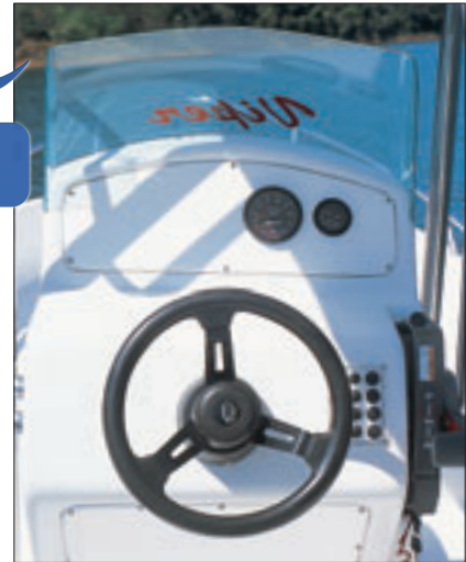
Painel Tem espaço suficiente para relógios bússola e eletrônicos básicos